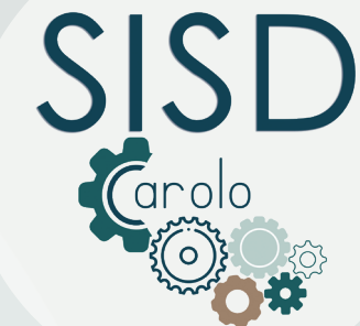
Plate-forme de concertation et de soutien pour l'ensemble des prestataires de soins ambulatoires

Editeur responsable : Mr Claude Decuyper 071/33.13.23